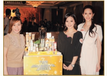
何傲兒和何傲芝是Burt's Bees護膚護唇產品的用家，這天特別前來祝賀品牌得獎。