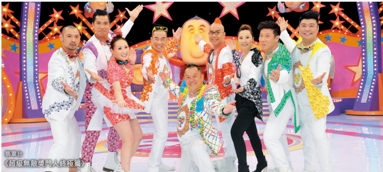
翡翠台 《超級無敵獎門人終極篇》