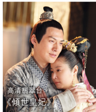
高清翡翠台 《傾世皇妃》