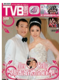
結婚大日子，《TVB周刊》當然跟進。