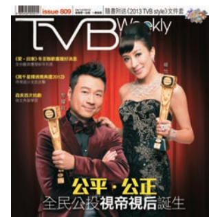
登上視帝視后寶座，為藝人的終極目標。默默耕耘的楊怡去年度終於達成理想，勇奪《萬星輝頒獎典禮》的「最佳女主角」。