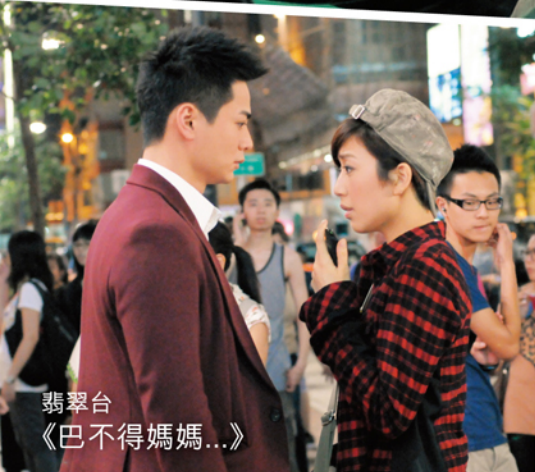
翡翠台 《巴不得媽媽...》