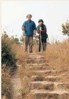
上年一首大熱廣東歌《天梯》，令到香港人對天梯這段感人故事加深認識，新劇亦以這個真人真事作藍本，歌頌至死不渝的愛。

「真的不太想，我想搞清楚拍劇與現實生活，如果將真感覺放在劇內，我覺得本身的經歷未必適合用到角色身上。我份人好低調，將現實生活mix埋拍劇，也不會好看，況且我做演員，也想演一些不同角色，而不是現實生活的我，這樣就沒有挑戰性，也不是演戲，所以不想有太多與他 (Moses) 一齊的戲，一來希望保護自己私隱，尊重對方，而且我想觀眾都是欣賞演技為先。」