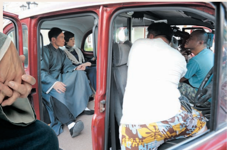
Moses今年出街的劇集，角色性格，人物造型各有特色，在《天梯》中，他以堅持愛情的藥農形象出現，與可頤成為情侶，繼續給予觀眾新鮮感。

「爭議性在於兩人之間年齡上的差距，加上可頤的角色本身有老公仔女，雖然他的老公最後死了，兩個才衝開隔膜相戀，不過以當時舊社會來講，這是一段不為人所認同的感情，對社會衝擊甚大。所以我尤其欣賞他們能夠捨棄所有，搬到深山居住，希望觀眾也能從中感受到默默守望對方，從一而終的愛情真的存在於世。」