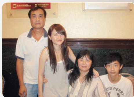
Mag說愛唱歌是受爸爸影響，小時候會跟父母去酒樓唱K，父女合唱，更大讚爸爸水準不俗，不知幾時大家可以欣賞這場父女檔演出呢？

不過最窩心的，還是父母對她的無限支持。「好記得決賽後得了冠軍的第一日，回想很不滿意自己表現，加上要面對好多傳媒壓力，被人追訪，感覺好驚之餘又擔心好似成個世界已經不一樣，心情好唔穩定，食飯無端端喊，媽咪無諗過我有這樣大的反應，她攬住跟我一齊喊，說怎樣好，一定會在我身邊，那一刻好感動。之後更同我說，既然我選擇了唱歌，就要學習成長，有時只要我用另一個心態去睇，其實不是我想像中的嚴重，她教我用正面方法去思考，希望我可以減輕壓力。」