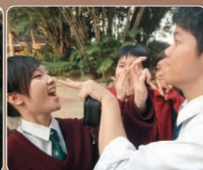
Mag很感激好多老師對她很好，其中有位教Chem的老師，很喜歡音樂，識好多音樂人，Mag贏了學校歌唱比賽後，間接為她組樂隊，更安排不少show給他們演出，幫她增加經驗。