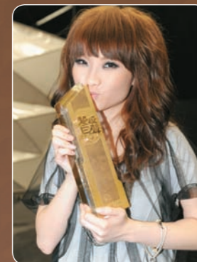
參加《超級巨聲2》為Mag做歌手夢邁進一大步，Mag說最希望自己的音樂能令人感動，成為別人的推動力，那就是她的音樂理想。