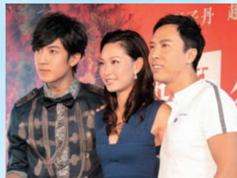
子珊認為拍電影的機會很難得，想不到會在電影《錦衣衛》中，和吳尊、趙薇、甄子丹合作。