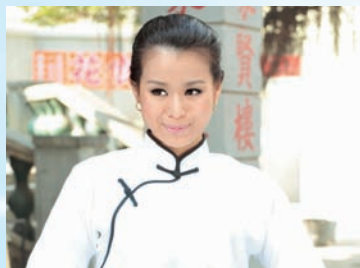
杏兒在《巴不得爸爸》中飾演老千，劇中更有多個扮鬼扮馬的造型，大晒杏兒搞笑細胞。