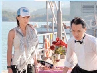
子珊與祖藍繼續合作無間，除了《美麗高解像》、電影《矮仔多情》後，最近合作賀年劇《情人眼裡高一D》。