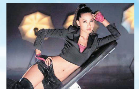
子珊當歌星的性感形象，與本身性格不同，因此要花很長時間，才能投入當一個性感偶像。