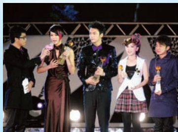
09年，杏兒得到四大樂壇頒獎禮的新人獎，今年對得獎期望不大，只希望來年有時間可以製作唱片。

經常在戲劇中接受新挑戰的杏兒，下年仍不會停步，繼續發展更多可能性。「今年過得很充實，由1月1日，在《叱咤樂壇流行榜頒獎典禮》得到「叱咤樂壇生力軍女歌手銀獎」已是個好開始，其後拍完《巴不得爸爸》，再到內地拍劇，其間還可以揀歌錄音，出到EP，整年的工作也很圓滿。其實我今年希望可以跳舞唱快歌，但未能達成，所以希望來年努力練習，達成願望。另外，我想下年可以試多些不同角色，接受新挑戰，好似楊怡在《宮心計》中做大奸角，也是我其中一個想嘗試的角色。」