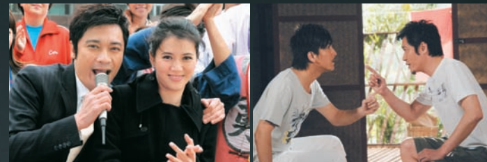
當視帝遇上影后，撈家與靚靚除了於劇中擦出火花，私底下都競爭激烈，鬥早到，大家真的要多多學習。