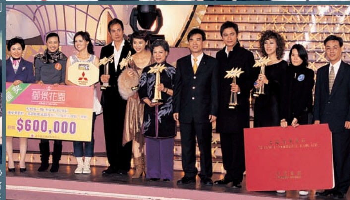
〇二年，撈家再憑《流金歲月》中飾演丁善本一角，重奪「本年度我最喜愛的男主角」，三度稱帝，締造視界神話。