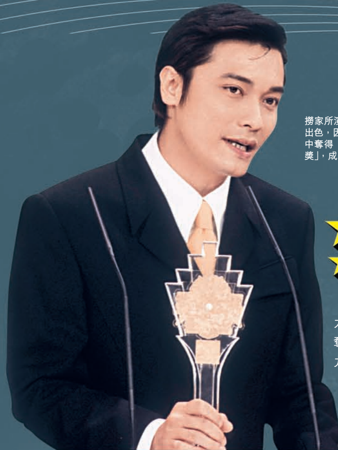
撈家所演繹的李奇，模仿呂奇出色，因而於第一屆「頒獎禮」中奪得「最佳劇中男角演繹大獎」，成為第一位視帝。