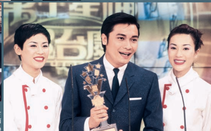
九七年，《難兄難弟》得到「全港最受歡迎電視節目（戲劇類）」，撈家與劇中兩位好拍檔宣萱和張可頤一同上台領獎。