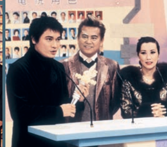
另外，撈家憑〇〇年《創世紀II天地有情》中的葉榮添（上圖）、〇一年《七姊妹》中的謝子堂（下圖）和〇二年《流金歲月》的丁善本，三年連續成為「本年度我最喜愛的電視角色」的得獎者之一，實力不容置疑。