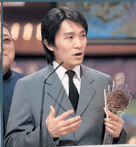
周星馳參加藝員訓練班而成為演員，演繹了無數家傳戶曉的電視人物：《黑白殭屍》的黑殭屍、《蓋世豪俠》的段飛、《他來自江湖》的何鑫淼（何金水）和《孖仔孖心肝》的王利就。加入電影圈後更上一層樓，自編自導自演，因而榮獲「翡翠星輝傑出成就大獎」。