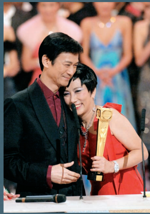
〇五年，一直演活嚴謹端莊角色的汪阿姐，罕見地發揮野蠻本色，以嶄新的形象性格，帶給觀眾無限驚喜，喜塔臘鑽蘭令她再度封后。