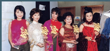
五位「我最難忘的女主角」齊齊列陣領獎，（左起）「程寶珠」張可頤、「馮程程」趙雅芝、「林亞珍」蕭芳芳、「好姨」薛家燕和「洛琳」汪明荃。